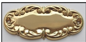
MOSIĄDZ POLEROWANY - ZŁOTO -