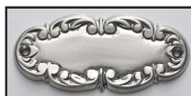
NIKIEL LUB CHROM - MAT -