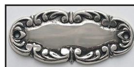
ANTYCZNE SREBRO - STARE SREBRO -

Na zdjęciu zestaw K-19-GK-2XL w kolorze mosiądz patynowany .