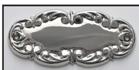
NIKIEL LUB CHROM - POŁYSK -