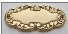
MOSIĄDZ MAT - ZŁOTO -