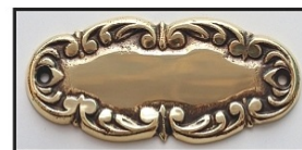
MOSIĄDZ PATYNA POLEROWANA - STARE ZŁOTO -