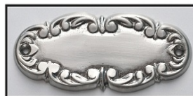
NIKIEL LUB CHROM - MAT -