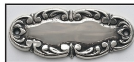
ANTYCZNE SREBRO - STARE SREBRO -

Na zdjęciu klamka mosiężna K-102-KL-SP w kolorze mosiądz patynowany .