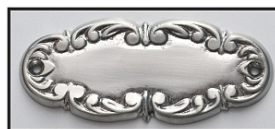
NIKIEL LUB CHROM - MAT -