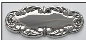
NIKIEL LUB CHROM - POŁYSK -